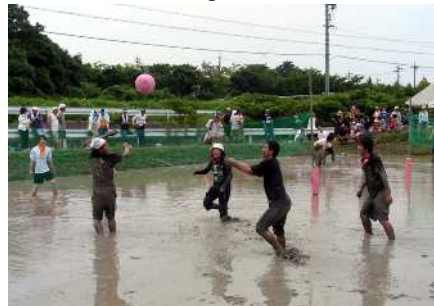
16 団体（150 人）が初夏の暑い日射しの中、泥まみれになりながらの熱戦を繰り広げた「泥んこソフトバレー IN KOMAKI」

青年会議所（通称：JC）は、日本全国 720 の地域に約 4 万人の会員を擁し、「修練」「奉仕」「友情」の三信条のもと、地域において率先して行動し「明るい豊かな社会」の実現を目指す青年団体です。メンバーは 20 歳から 40 歳までの志の高い青年経済人によって構成されており、まちづくりに関する会議やイベントの企画・運営を通して、LD（リーダーシップデベロップメント）と CD（コミュニティデベロップメント）の研究に努めています。