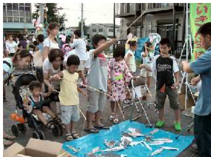
子ども達でにぎわう魚釣りブース。狙うは大物！？みんな真剣です！

2007 年 3 月と 5 月にはにぎわい創出事業として駅西ひろばのにぎわい創り、今年 3 月に「小牧アートフェスタ上街道」で旧商店街でのにぎわい創り、そして 7 月 26 日～27 日の「小牧七夕まつり」の協力と活動を広げてきました。七夕まつりは初めての会場で人の動きが不安でしたが、めいきんブースは「輪投げ」「魚釣り」で参加しました。特に「魚釣り」は海の図鑑から愛知で獲れる魚の