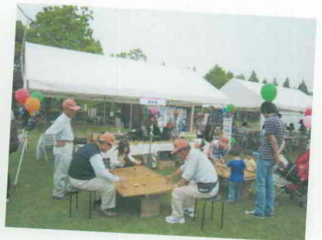
▲くつろぎ広場に設けられた「こまぎコミュニティーひろば」。市民活動団体がそれぞれの持ち味を生かした体験&遊びで、来場者を迎えました。