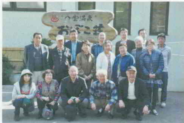
宿泊先「おぼこ荘」前で記念写真

旅程は、1日目に中部国際空港から函館経由で八雲町に向かい「八雲町郷土資料館」を見学。「おぼこ荘」で宿泊し「小牧市と交流する八雲町民の会」と炉端焼きで懇親会。2日目は「八雲町活性化施設」でバター作りと「八雲神社・八雲産業 八雲事業所」「八雲町育成牧場」見学に続き、