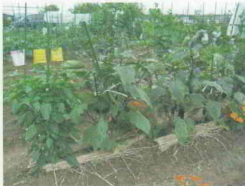
◀ 収穫時期を迎えたナス。所々に植えられたマリーゴールドはコンパニオンプランツ(共栄植物)といって、植物同士の生長を助けたり、害虫を寄せ付けなくする働きがあります。(6月20日撮影)