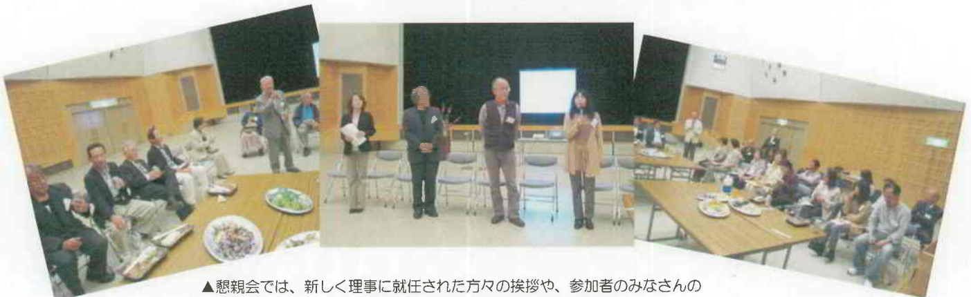
▲懇親会では、新しく理事に就任された方々の挨拶や、参加者のみなさんの活動PRタイムなど、軽食を摂りながら和やかに進められました。