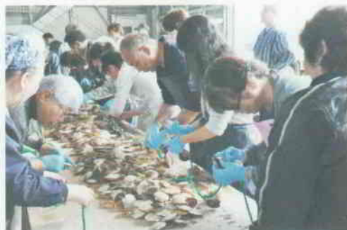
ホタテの稚貝の耳に開けられた小さな穴に、紐通して吊るす「耳吊り作業」を体験中！

「噴火湾パノラマ周辺」を散策。「ホタテ耳吊り作業見学と体験」「ホタテ三味の昼食」と多くの体験と美味しい昼食を堪能後、大沼公園や五稜郭周辺も散策し宿泊先到着後各自自由行動。3日目は、午前中函館で自由行動。午後は函館空港より中部国際空港へ。参加者からはバター作りは未完成で大変だったが、ホタテの耳吊り体験は良かったとの意見。今後、これらの意見を参考に交流体験事業を検討します。