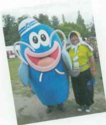
▲あいち防災キャラクター 防災ナマズンも登場!