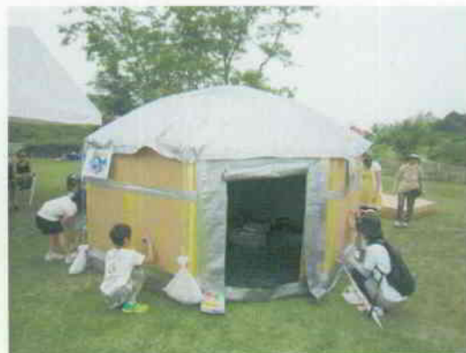
◀ 特殊加工段ボールでできた非常用テント「オクタゴン」が設営され、外壁に、思い思いに絵を描く子ども達。テントの中では、防災啓発ビデオが上映されました。