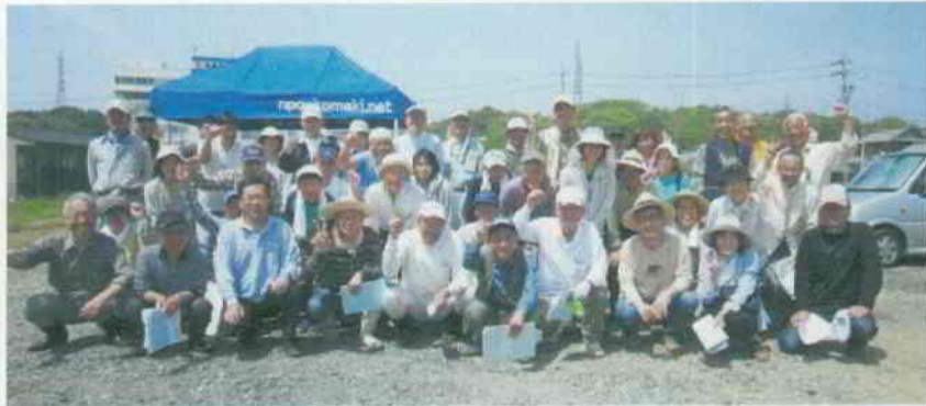
▲H24年度の総会后に、「おいしい野菜をつくるぞー！」と気合を入れた集合写真。(赤堀地区内「明るい農縁」にて5月2日撮影)