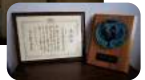
▲総会冒頭の挨拶で、昨年11月に地方自治法施行70周年を記念して総務大臣より表彰を受けたことの報告がありました。