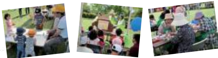
▲昨年の「こまきコミュニティひろば」の様子