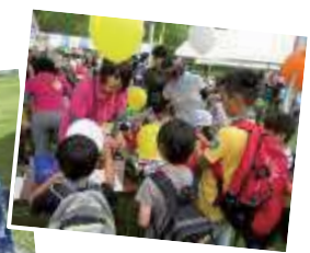
▲「こまきコミュニティーひろば」の様子