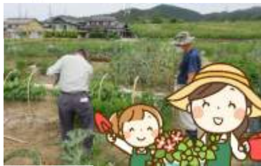
▶農縁で作業をする利用者さん

皆さん、新型コロナウイルスに負けないように元気な野菜を育てています。(農縁担当：立川)